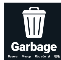
Etiqueta para basura (6 x 6 pulgadas)