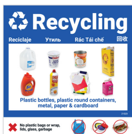
Etiqueta para reciclaje (10 x 10 pulgadas)