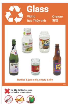
Póster para reciclaje de vidrio (11 x 17 pulgadas)