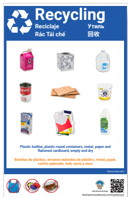
Póster para reciclaje (11 x 17 pulgadas)