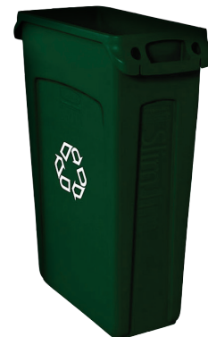
Contenedor para desechos de comida 23 galones (22"L x 11"W x 30"H)