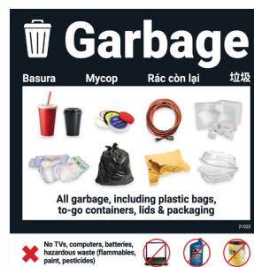
Etiqueta para basura (10 x 10 pulgadas)