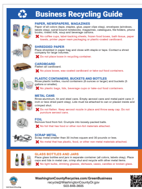
Guía de reciclaje para negocios (8.5 x 11 pulgadas)