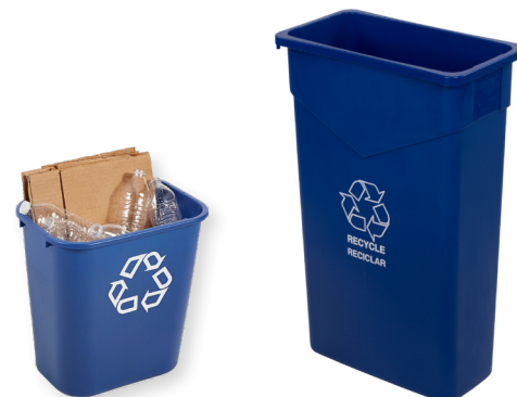
Contenedor para reciclaje 7-galones (14"L x 10"W x 15"H)