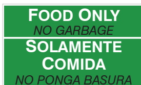
Etiqueta sin imágenes para solo comida (6.5 x 11 pulgadas)