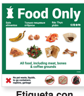
Etiqueta con imágenes para solo comida (10 x 10 pulgadas)