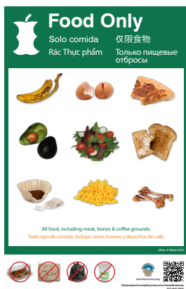
Póster para solo comida (11 x 17 pulgadas)