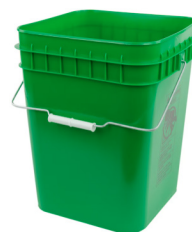
Cubeta para desechos de comida 4 galones (9.75"L x 9.75"W x 13"H)