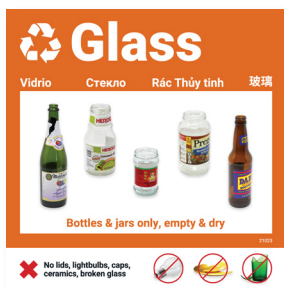
Etiqueta para reciclaje de vidrio (10 x 10 pulgadas)